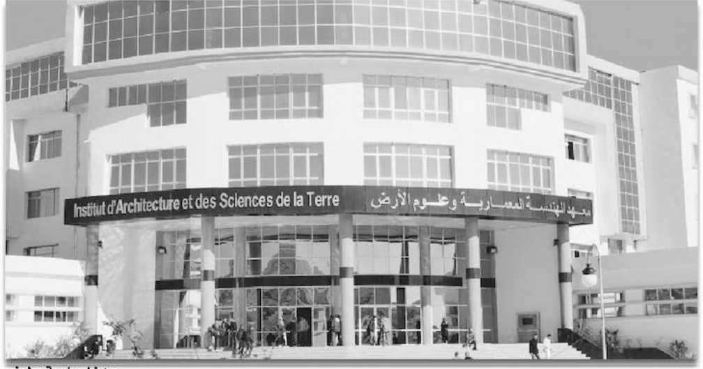
مدخل جامعة سطيف

وهدد من جهة أخرى، الاتحاد العام الطلابي الحر، بشل الأحياء الجامعية للذكور والبنات والقيام بتسطير حركة احتجاجية واسعة، بالإضافة إلى الاعتصام أمام مقر مديرية الخدمات الجامعية، احتجاجاً على ما وصفه بتراكم المشاكل الاجتماعية على مستوى هذه الإقامات، والماطلة في إيجاد الحلول لها من طرف الإدارة.