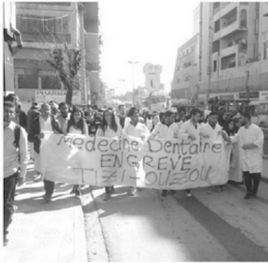
نحو إيجاد حل لمطالب طلبة جراحة الأسنان

المسيرة انطلقت من كلية الطب نحو رئاسة الجامعة، أين اعتصم الطلبة مطلقين العنان لخناجرهم، التي أطلقت هتافات تندد بطريقة تعاطي الإدارة مع مطالبهم، التي رفعوها أكثر من مرة بخصوص توفير المواد المستلزمة لسير حصص التطبيق، وجلب المزيد من الأساتذة المحاضرين لتغطية النقص الملحوظ، إضافة إلى برمجة موقع إلكتروني لنشر النقاط ومختلف الإعلانات الخاصة.