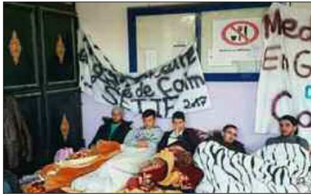
■ Des étudiants en grève de la faim.

→ Les étudiants en médecine dentaire et les étudiants en pharmacie, en arrêt de cours depuis trois mois, ont entamé mardi passé une grève de la faim. Face à cette situation, le département de l'Enseignement supérieur et de la Recherche scientifique rassure que leurs revendications objectives ont été prises en charge.