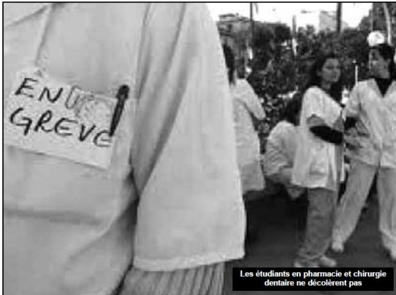
Les étudiants en pharmacie et chirurgie dentaire ne décolèrent pas

Chose promise, chose due, le Premier ministre a posté, jeudi dernier, un second twitt pour leur donner rendez-vous cet après-midi. « Je recevrai les représentants des étudiants en pharmacie et en chirurgie dentaire dimanche prochain à 15h au Palais du gouvernement », a posté à la « Trump » un Sellal qui semble s'être mis au réseau social favori du président américain. Presque trois mois après son début, la grève des étudiants en pharmacie et chirurgie dentaire pourrait connaître son épilogue aujourd'hui au niveau du